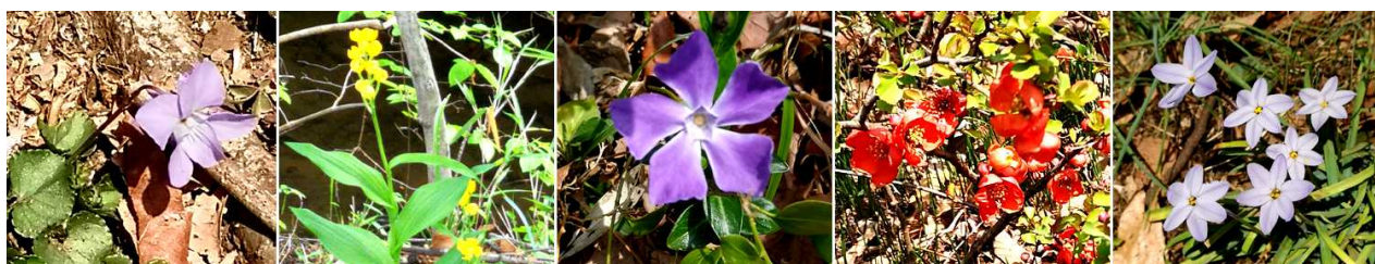
玉川上水の春の花:左よりスミレ、キンラン、ツルニチニチソウ、クサボケ、ハナニラ