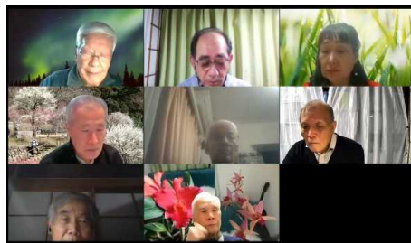
2022年2月例会の一画面

まだまだZoomの機能を十分に発揮出来ていませんが、集合会議のメリットを生かしたWeb会議を併用できるようレベルアップを図って行きたいと思っております。